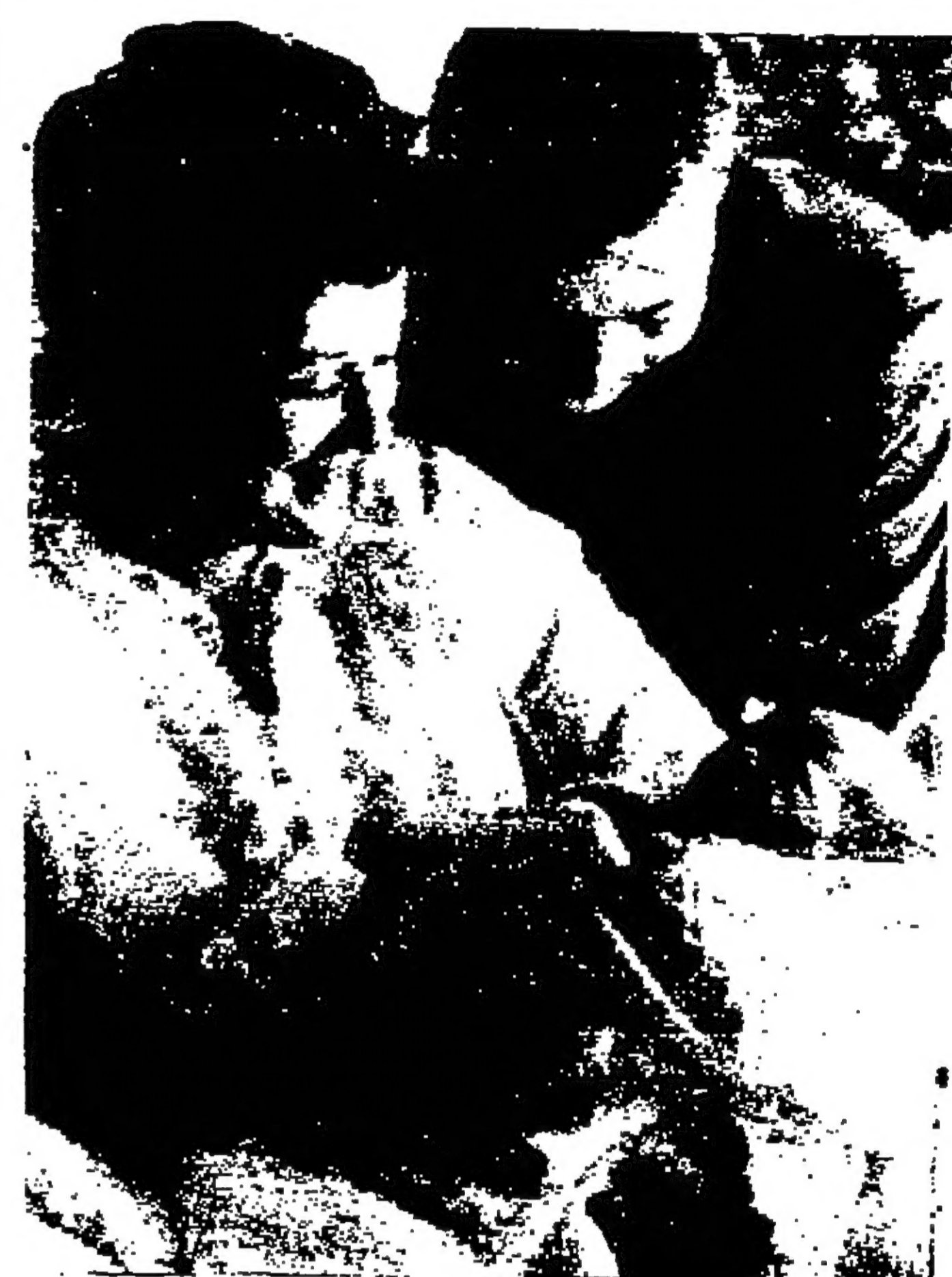
انتم الله على سبيله الشريف غلزيين راكنا وعقبه سبيله الشريفه « خريه » ببولوده جميله اسماسا « راجده » باجيا والى الف بركوك

وصول العروسين وفد حفل المزدحم الذي احتضرت فيه حفلة « كريستا » العظمى الزمن وكان يبردي بنه زرقا ودمعته